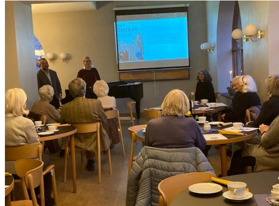
Stor interesse for foredraget om Norges første kvinnelige prest.

hun klarte å stå i striden og bli Norges første kvinnelige prest mot mye motstand?