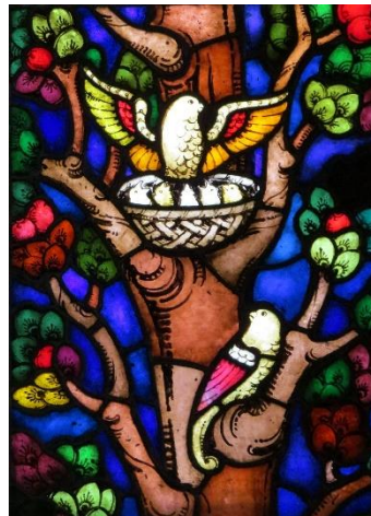
Detalj fra Per Vigelands glassmalerier.

Kirkekaffen vil bli arrangert i Kirkestuen igjen. Det er plass til 30 personer. Det blir dekket på med plass til tre personer ved hvert bord. Jeg er sikker på at dette kommer til å bli fint på alle måter. Vi ses i kirken!