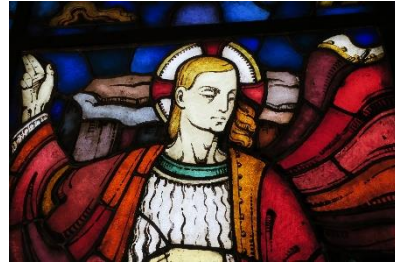
Detalj fra Per Vigelands glassmalerier.