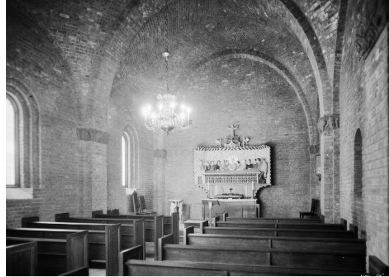
Frogner kirkes kapell

Fredag 17. september er det Oslo Kulturnatt. Kulturutvalget i Frogner menighet er også i år med i programmet.