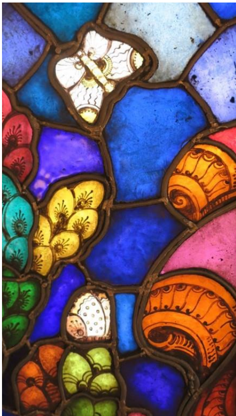
Per Vigeland, detalj fra Markusvinduet