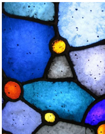
Per Vigeland, detalj fra alterbildet