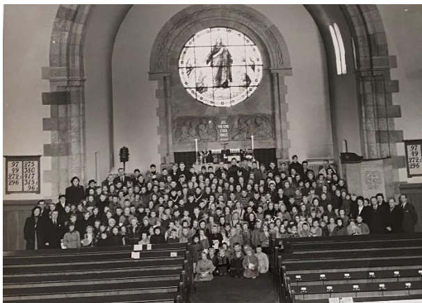
Søndagsskolen i Frogner på 50-årsjubileet i 1955

som er tatt i forbindelse med 50-års jubileet til søndagsskolen. (Se bilde)