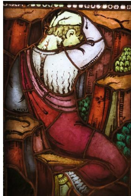
Detalj fra Per Vigelands glassmalerier.

BØNNEDAGSGUDSTJENESTE med allment skriftemål og med kirkekaffe Bots og bededag Margunn Sandal, Håvard Ringsevjen, orgel