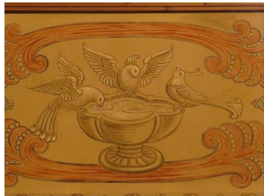
Detalj fra orgelgalleriets brystning.

Vi kommer til å savne de gode kollegaene våre. Det er ingen tvil om det. Og vi er spent på hvem som kommer etter dem. Heldigvis er det gode prosesser i gang for å få tilsatt etterfølgere i alle stillinger, og ut over det kan vi bare oppfordre alle til å be om at det kommer nye gode krefter til menigheten.