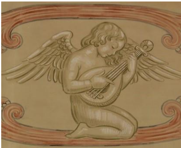
Detalj fra orgelgalleriets brystning.

Vi behøver ikke være redde. Vi står trygt.