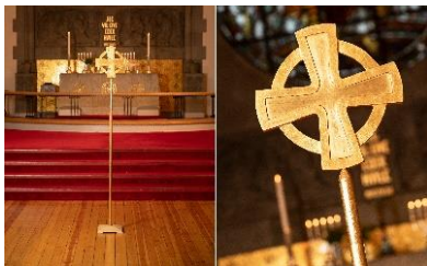
Prosesjonskorset i Frogner kirke