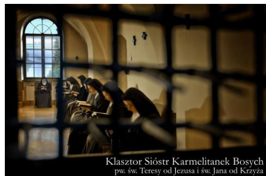
Karmelitternonner bak gitteret i det lukkede klosteret i Krakow